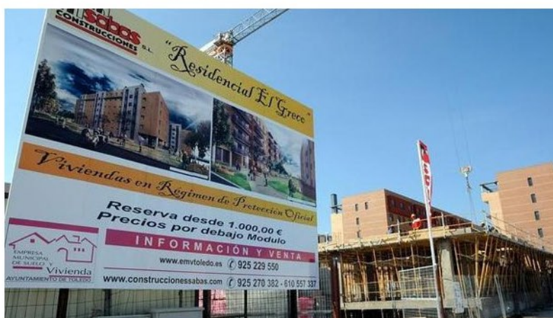
El Gobierno ha ayudado una serie de ayudas al alquiler para los más jóvenes